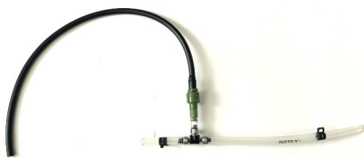
Spezielles Kit Rotax (A)

3) Montage des speziellen Schlauchkits (A) oder des Standard Kits (B)