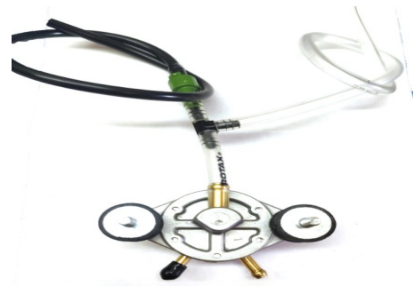
Standard Kit (B)